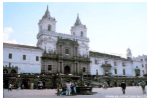
Iglesia de San Francisco