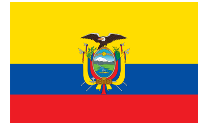
Official Flag of Ecuador

Bar temático americano con televisores que siempre muestran los juegos de fútbol.