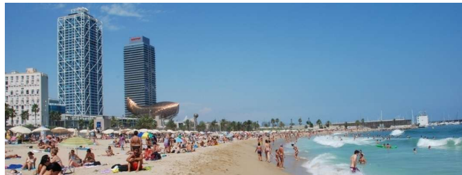
(Barcelona playa) (Ofrecido en el paquete de siete y nueve días)

Dirección - 5925 Avenida de Malvern Filadelfia, Pensilvania