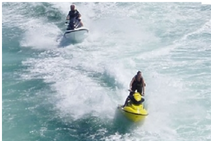
(Barcelona Jet Ski) (Ofrecido en sólo paquete nueve)