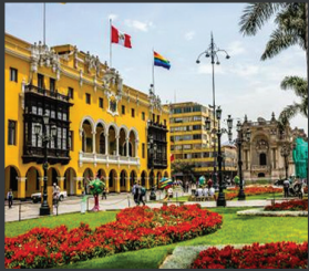
Plaza de Armas