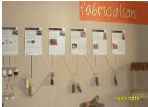
Museo Infantil Trampolin: