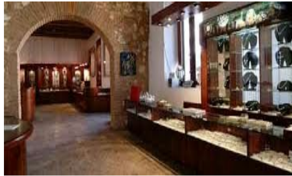
ChocoMuseo Santo Domingo: