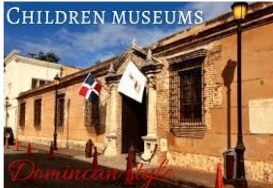
Museo de las Casas Reales: